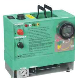
インパルサー® IPV 在宅機種