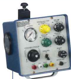
IPV®-2C IPV 上位機種