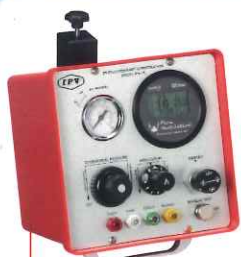
IPV®-1C IPV 標準機種